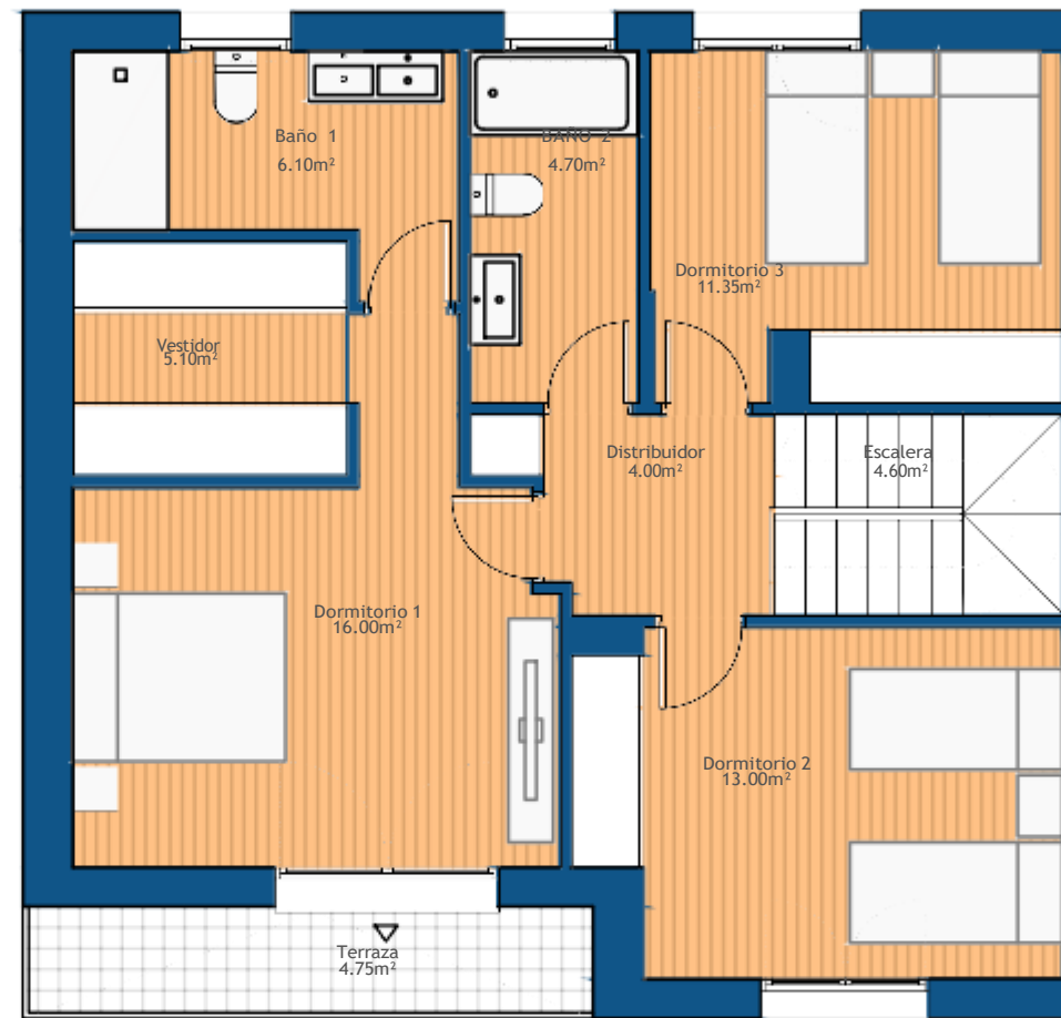
PLANTA PRIMERA Sup. construida = 80.40m 2